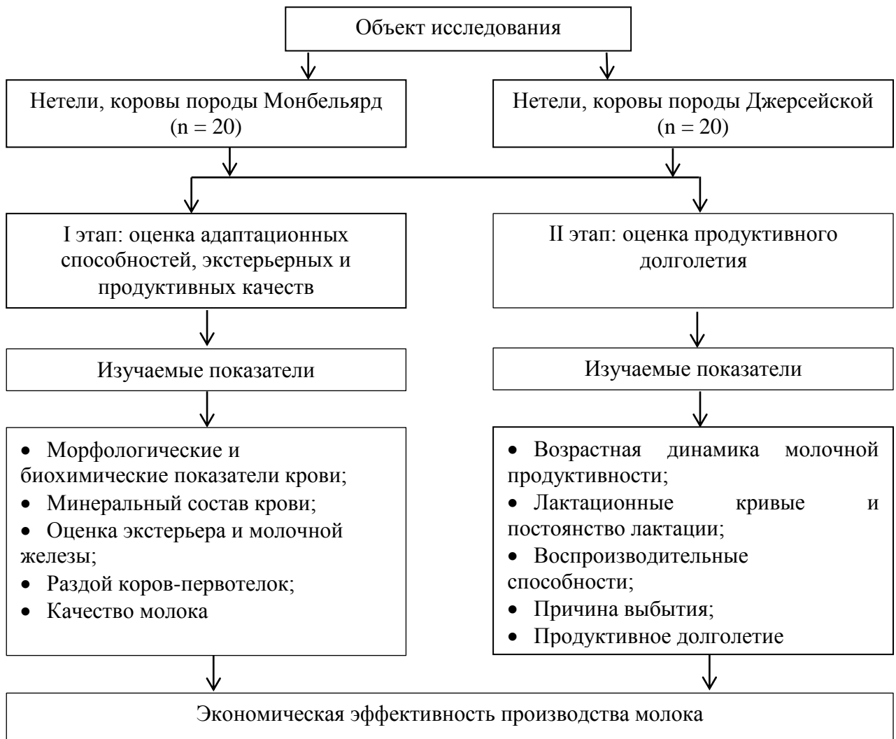
Рисунок 1. - Схема исследований

Молочная продуктивность подопытных животных изучалась в трёх временных периодах: на протяжении первых 100 дней раздоя, за 305-дневной лактации, а также за весь период первой лактации в целом. Величина удоя устанавливалась на основании ежедневных контрольных доений. Массовая доля жира и белка в молоке, а также абсолютный выход этих компонентов фиксировались с ежемесячной периодичностью. На третьем месяце лактации, в фазе раздоя, было проведено детальное изучение качественного состава молока.