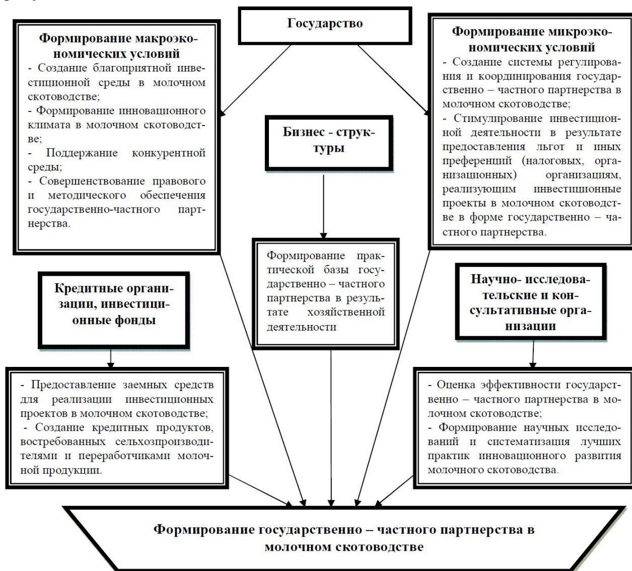
Рисунок 1 – Влияние субъектов на формировании государственно – частного партнерства в молочном скотоводстве

В качестве основных субъектов, участвующих в формировании государственно – частного партнерства в молочном скотоводстве Амурской области, выступают органы государственной власти, производители и переработчики сельскохозяйственной продукции, научно-исследовательские, консультативные и кредитные организации. Влияние данных субъектов на формирование государственно – частного партнерства в молочном скотоводстве представлено на рисунке 1.