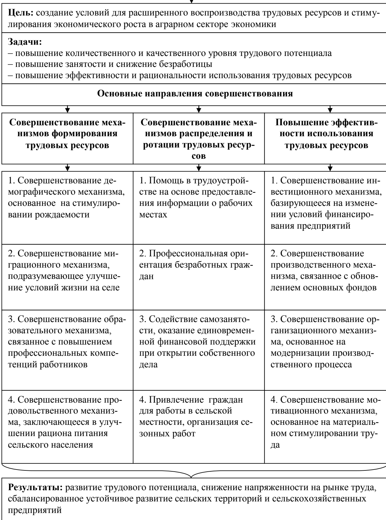
Рисунок 3 – Концептуальная модель совершенствования организации воспроизводства трудовых ресурсов