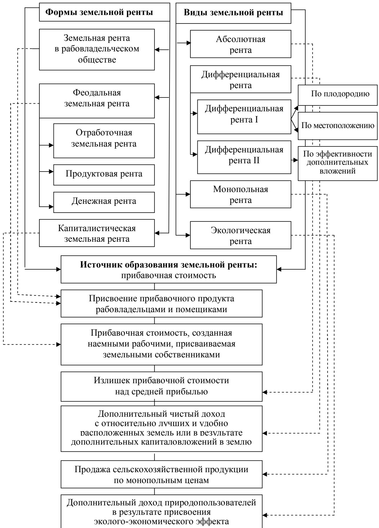
Рисунок 2 – Научные основы формирования земельной ренты