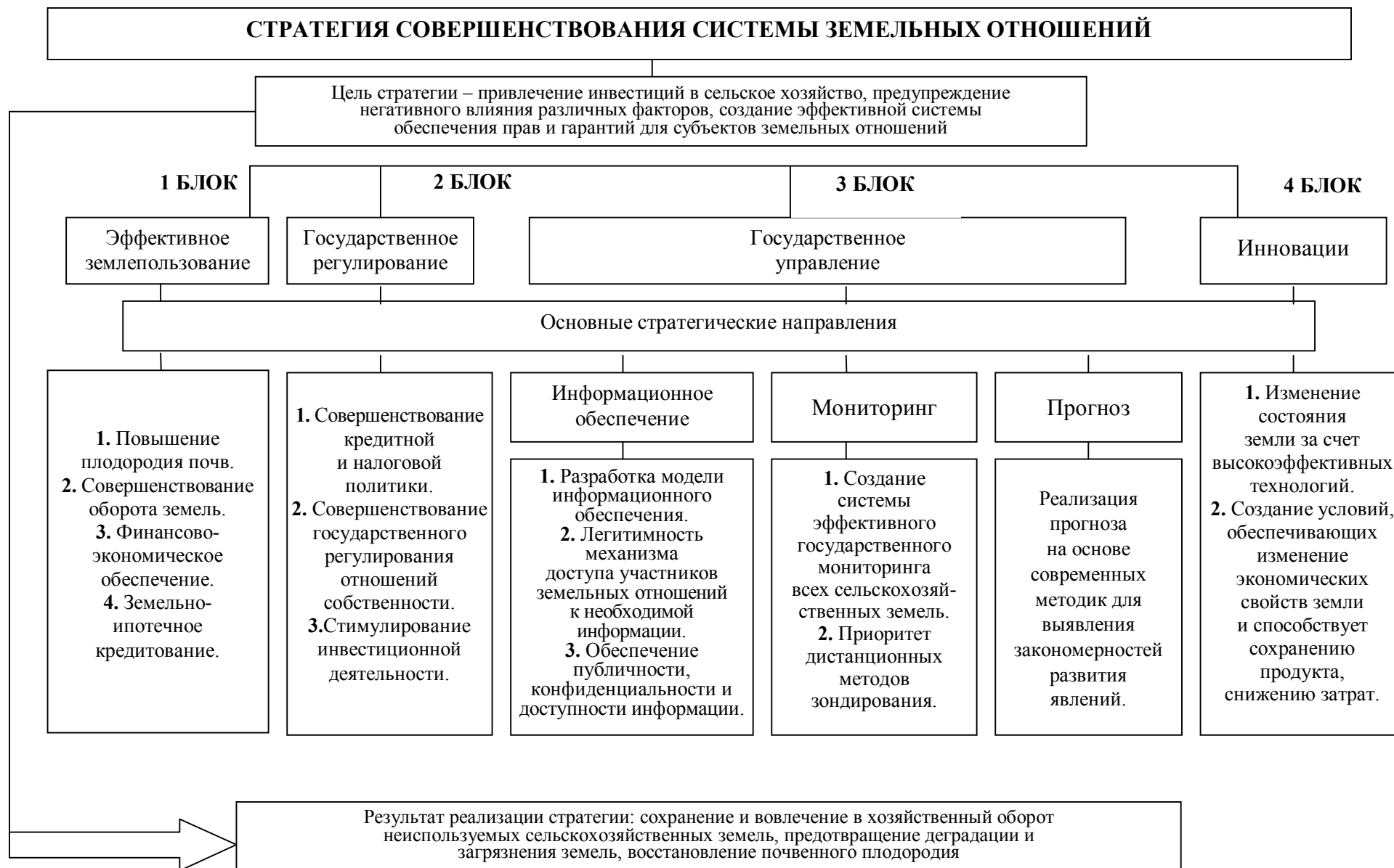
Рисунок 3 – Стратегия совершенствование системы земельных отношений