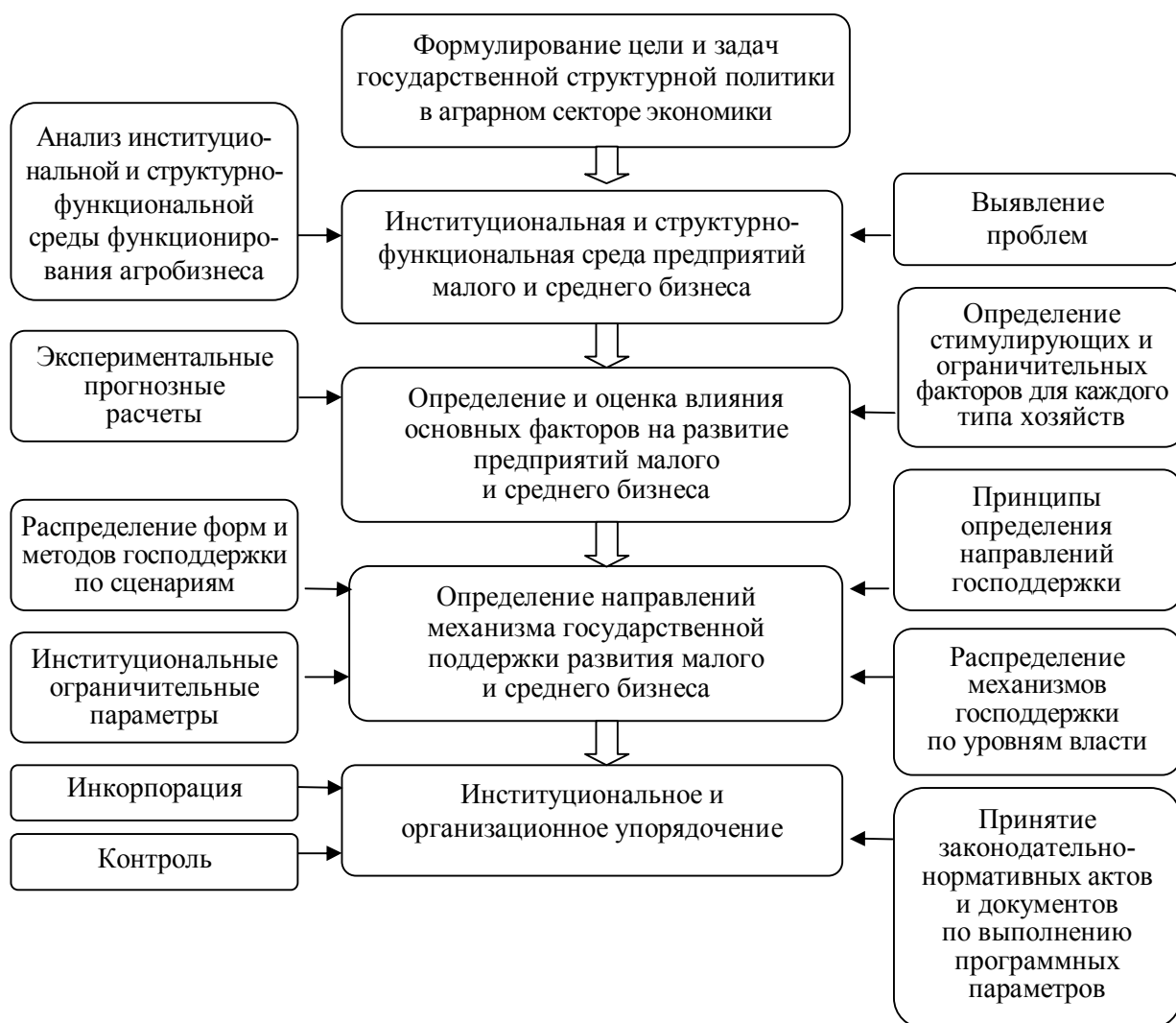
Рисунок 1 – Алгоритм разработки механизма государственной поддержки развития малого и среднего бизнеса в сельском хозяйстве (авторская разработка)

Рассматривая механизм государственной поддержки развития предприятий малого и среднего бизнеса, автор исходит из того, что это взаимозависимая совокупность основных элементов в виде составляющих организационного и экономического воздействия, обеспечивающих устойчивое развитие с помощью прямых и косвенных методов. Алгоритм разработки механизма государственной поддержки развития предприятий малого и среднего бизнеса представлен на рисунке 1.