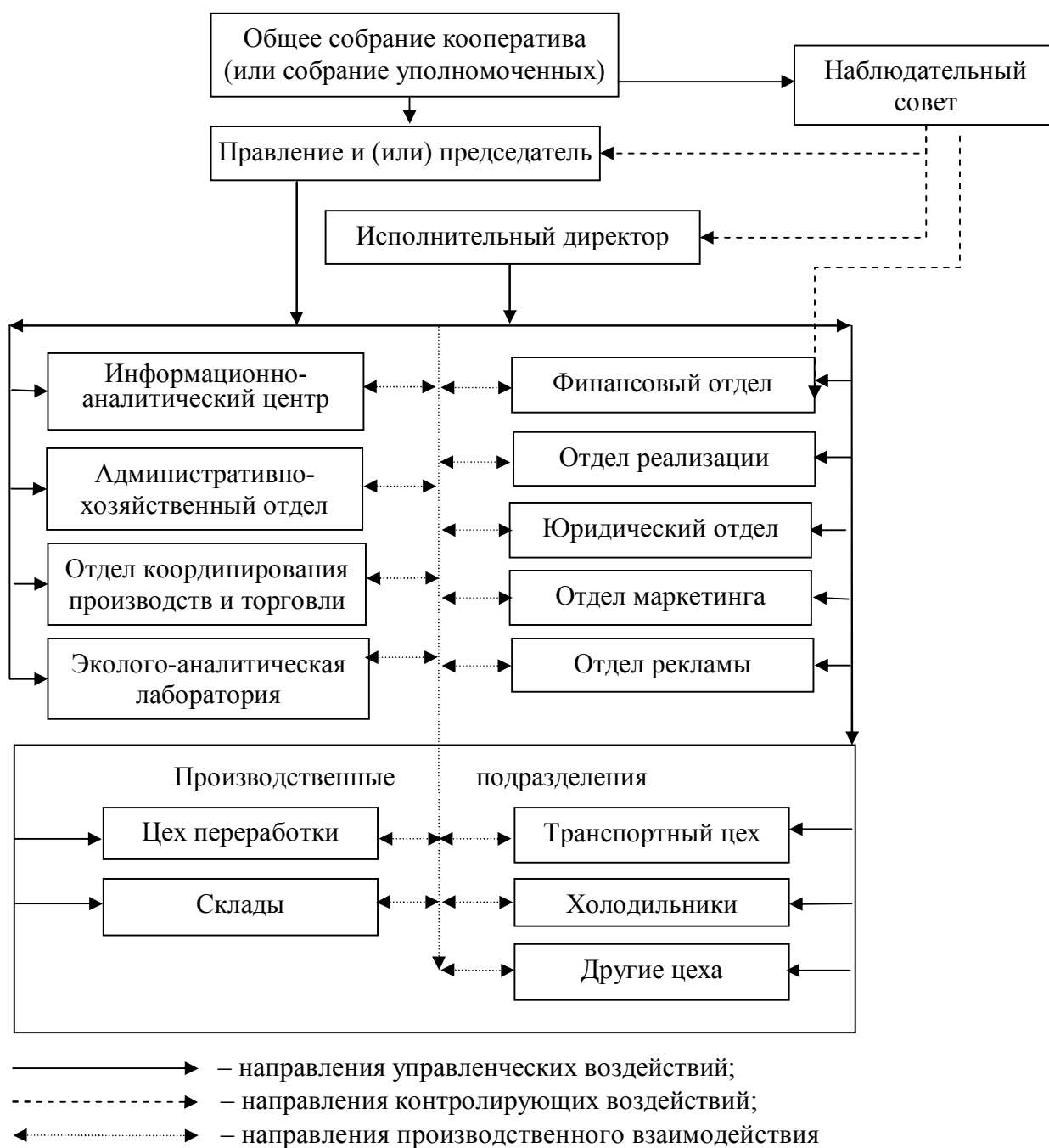
Рисунок 3 – Организационная структура оптового распределительного центра (авторская разработка)

Таким образом, создание оптовых распределительных центров позволит: построить эффективную систему заготовки, хранения, переработки и сбыта сельскохозяйственной продукции; повысить уровень занятости сельского населения; эффективно развивать сельскохозяйственную потребительскую кооперацию; создать инструмент регулирования потоков движения продовольствия; увеличить производство отечественной конкурентоспособной продукции; обеспечить формирование и соблюдения стандартов; обеспечить население высококачественной местной продовольственной продукцией.